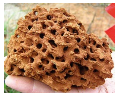
蟻巢內之蜂巢狀結構