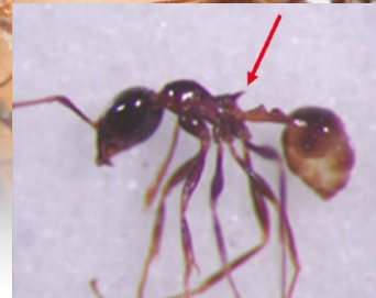
擬大頭家蟻屬有前伸腹節齒