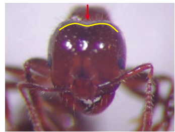
入侵紅火蟻後頭部平順無凹陷