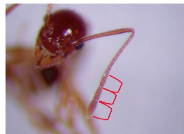
大頭家蟻屬錘節 3 節