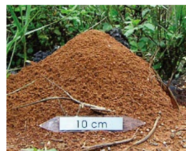
入侵紅火蟻成熟蟻巢

明顯隆起的蟻丘是最容易辨別入侵紅火蟻的方法，因為台灣約 270 種螞蟻中，沒有會築出高於地面 10 公分蟻丘的種類，蟻丘內部呈蜂巢狀結構，但需注意蟻巢初形成時並無明顯之蟻丘，易與其它種類螞蟻之蟻巢混淆。