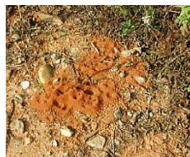
入侵紅火蟻初期蟻巢無明顯隆起