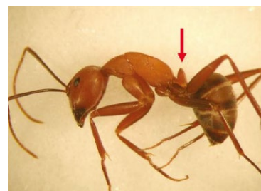
非火蟻之其它亞科螞蟻