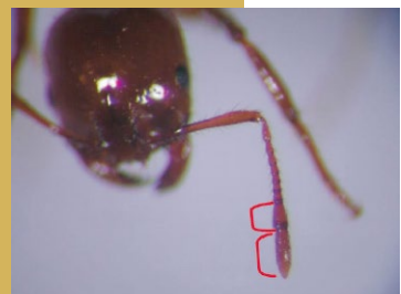
火蟻屬錘節 2 節