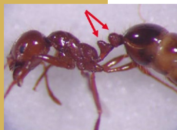
火蟻所屬之家蟻亞科