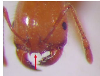
熱帶火蟻無頭楯中齒