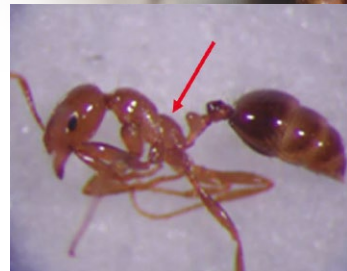
火蟻屬無前伸腹節齒