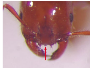
入侵紅火蟻有明顯頭楯中齒