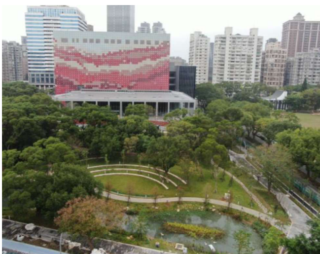
國家檔案館外觀實景圖 1