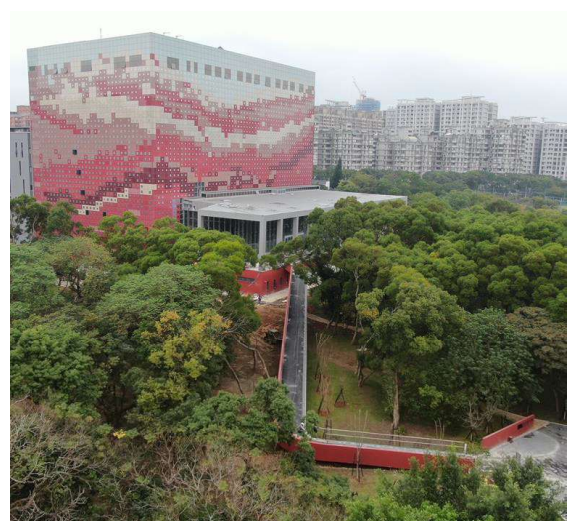
國家檔案館外觀實景圖 2