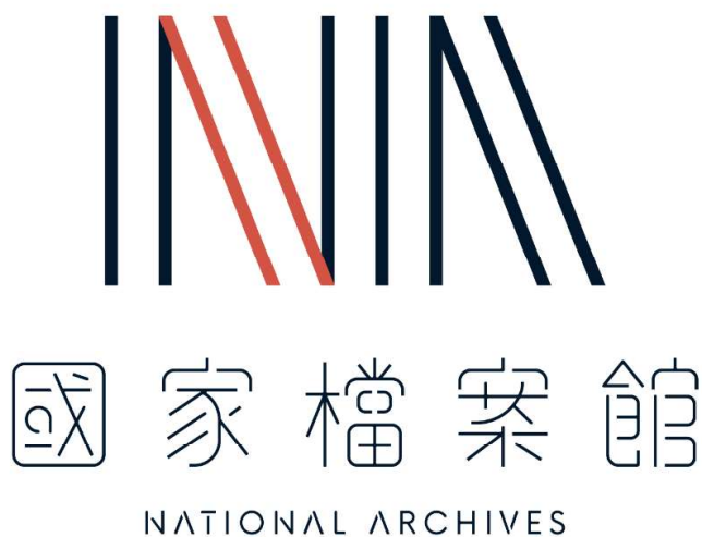
國家檔案館視覺標誌圖 2