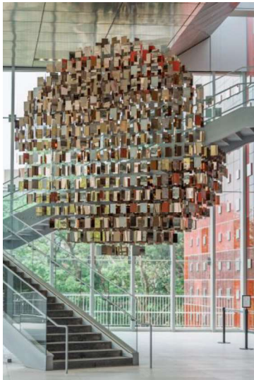
國家檔案館「以史為鏡」公共藝術照

請至檔案局全球資訊網/認識我們/局館簡介/本館簡介/場域介紹，查看相關資訊。( https://www.archives.gov.tw/tw/arctw/699.html )